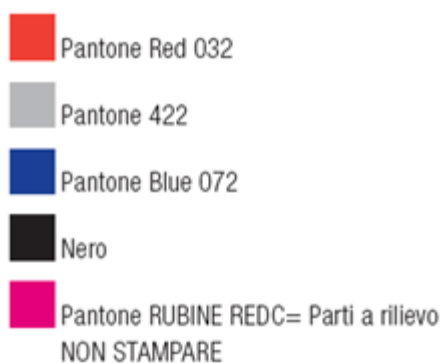
Figura 1 – Layout BIP PO

La parte in rilievo dei caratteri Braille dovrà essere posizionata sul lato posteriore della smart card (pallini viola).